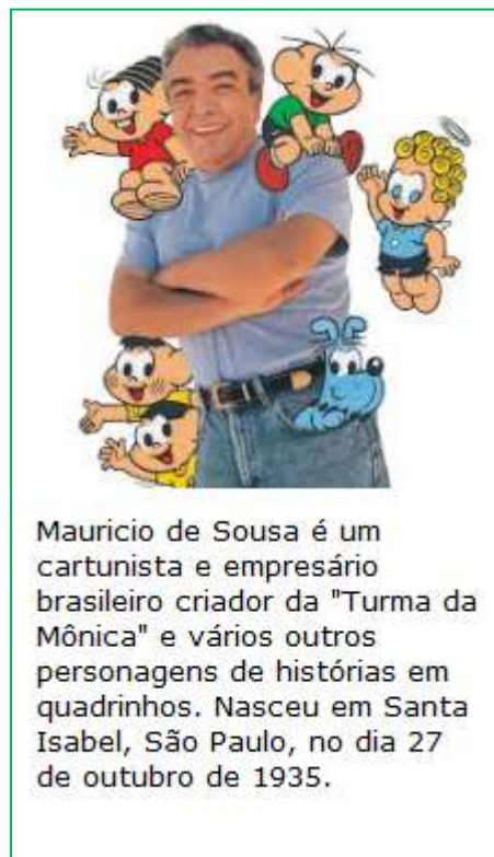
Mauricio de Sousa é um cartunista e empresário brasileiro criador da "Turma da Mônica" e vários outros personagens de histórias em quadrinhos. Nasceu em Santa Isabel, São Paulo, no dia 27 de outubro de 1935.

Revista - Vivemos um momento de intolerância também no Brasil. De que forma sua atuação pode despertar nas novas gerações uma maior aceitação